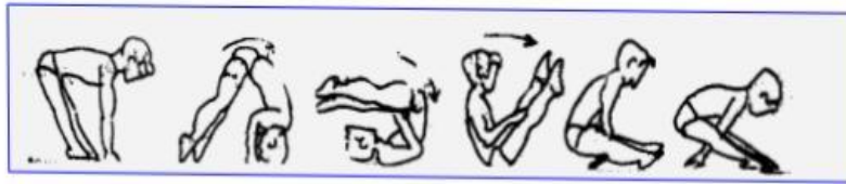
شكل (1) يوضح الدرجة الامامية فتحا