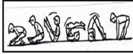
شكل (2) يوضح الدرجة الخلفية فتحا

7_الدفع بإذراعين للعودة لوضع الوقوف فتحا