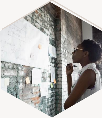
البعد المؤسساتي التقني

تعنى التنمية المستدامة بالتكنولوجيا النظيفة والمُحسنة بغرض التقليل من استهلاك الطاقة وتقليل الملوثات عن طريق استثمارات كبيرة في التكنولوجيا المكتسبة (استثمارات التعليم والتنمية البشرية) بإيجاد مصادر طاقة بديلة.