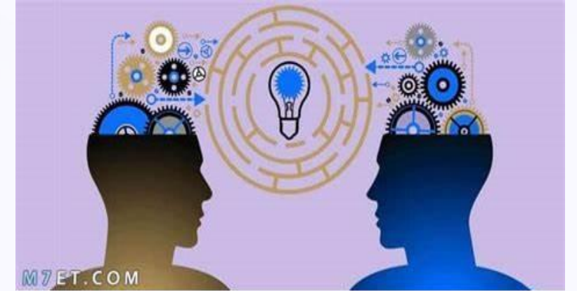
الحوار وتبادل الأفكار

تمكين الشباب من المشاركة في المبادرات التطوعية والمشاريع التنموية المحلية يعزز مهاراتهم ويعزز انتمائهم للمجتمع. هذا يساهم في بناء مستقبل مستدام للعراق.