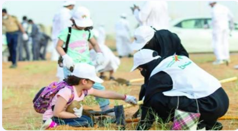
المشاركة في المشاريع التنموية