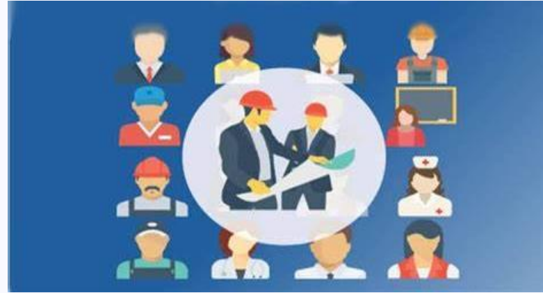
التثقيف والتوعية المجتمعية